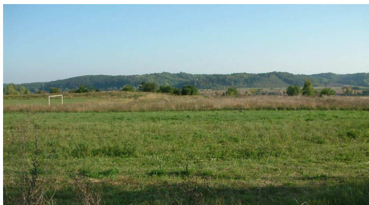
A Zselic északi nyúlványa szegélyezi a községet

Az utcakép kedvező, gondozott lakóházak, rendezett porták fogadják az ide látogatót. A lakóházak többsége az oldalhatárral párhuzamosan épült és kisebb előkerttel rendelkezik.