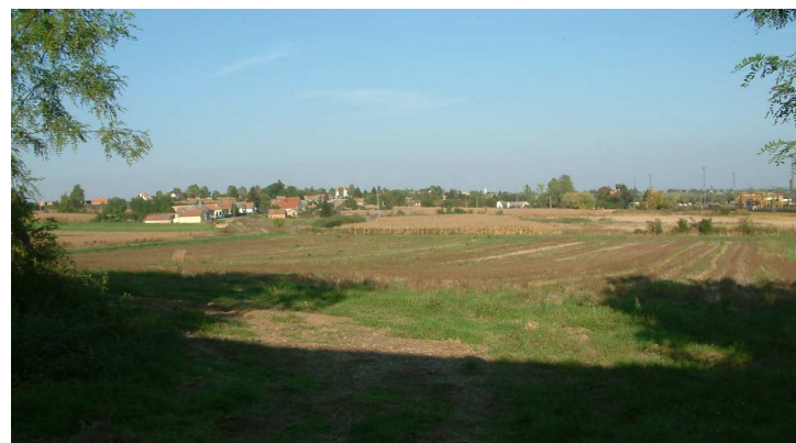
Csoma látképe Szabadi felől